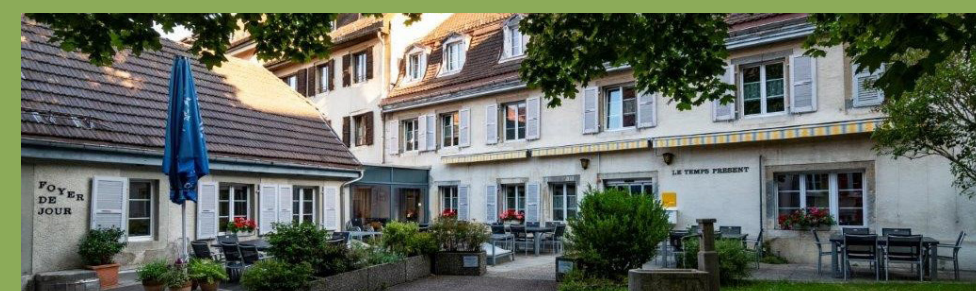
Home médicalisé Le Temps Présent

L'idée d'une fusion avec la Fondation Le Temps Présent débute dès 2017, suite à une demande faite par le canton. Après de longues discussions, pour assurer la pérennité de la mission court séjour dans le Haut du canton, mais aussi pour maintenir les emplois, la fusion a été validée en 2021.