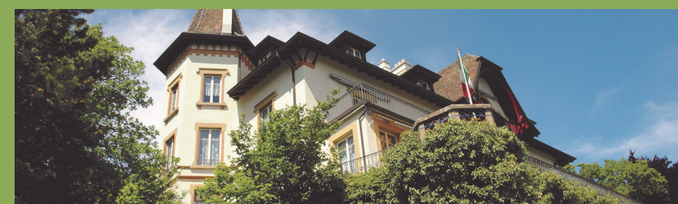
Home médicalisé l'Ermitage

En 2019, la Fondation « du Home de l'Ermitage et des Rochettes, hôtel des associations » s'est approchée de notre fondation pour que le Home de l'Ermitage intègre la FECPA. La Fondation du Home de l'Ermitage et des Rochettes estimait qu'au vu de la complexité des dossiers dans le domaine de la personne âgée, un rapprochement avec d'autres institutions assurait l'existence de l'Ermitage dans la durée. La fusion est intervenue en 2020.