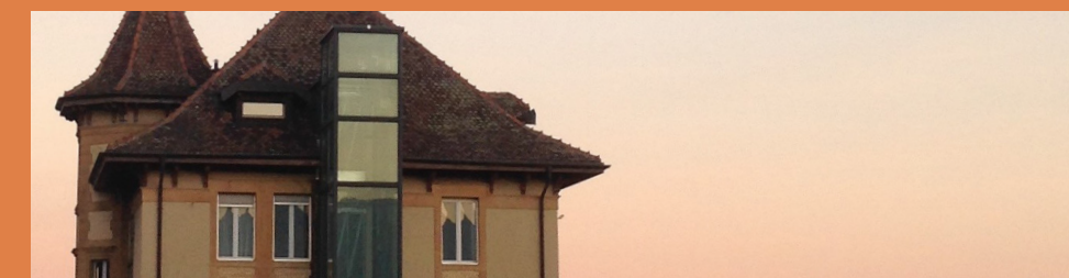
Home médicalisé Le Clos

Chose faite presque cent ans plus tard. Fin 1984, c'est au tour de la Pension des Lilas à Chézard d'accueillir à « titre d'essai » un couple et comme l'écrit sa directrice « ne pas aller à contre-courant des besoins d'une époque ». Une année plus tard, l'essai étant concluant, la mixité devient la règle. Quant à la Pension Le Clos à Serrières, M. Joss en sera le premier pensionnaire homme en janvier 1990, puis un second arrivera en fin d'année.