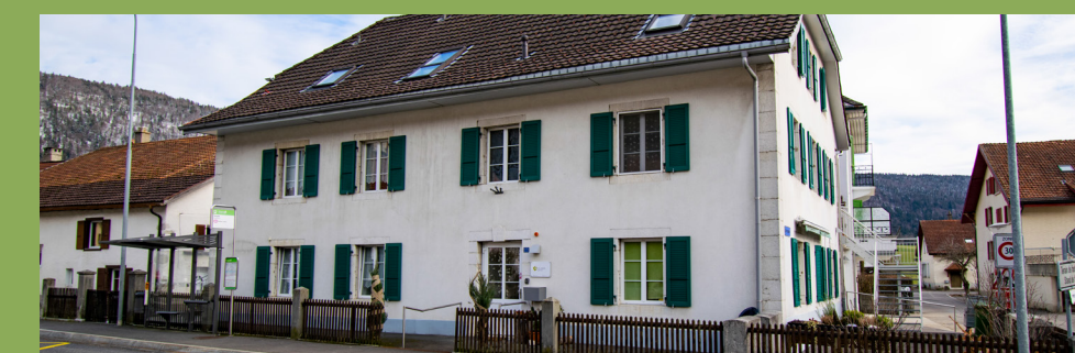
Pension Le Logis

La FECPA s'est rapidement positionnée comme acteur important de la PMS. En 2014 est inaugurée La pension Le Logis, un projet pilote à Dombresson. Le Logis accueille aujourd'hui 13 pensionnaires en âge AVS, voire AI proches de l'AVS, qui ne nécessitent pas de surveillance constante mais un encadrement en journée par une équipe du service d'animation. La mission pension offre un lieu de vie protégé, garantissant un accompagnement dans les activités quotidiennes, un soutien psychologique et social ainsi que des prestations hôtelières et d'animation, les soins infirmiers, thérapeutiques et médicaux étant fournis par des prestataires externes.